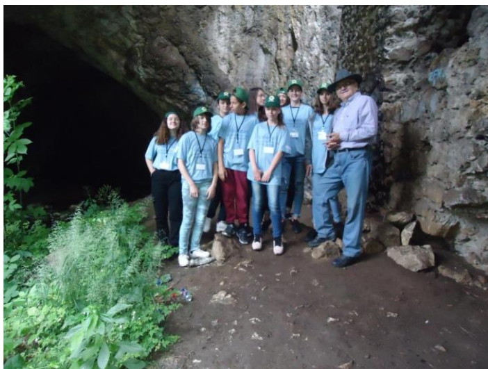
În interiorul peșterii Gaura cu Muscă

În cadrul acestor activități 14 elevi participanți la cursul de agent ecologic voluntar, realizat de către GEC Nera în cooperare cu școala în perioada decembrie 2018 - aprilie 2019, au primit certificate de absolvire a cursului într-un cadru festiv.