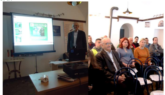
Workshop la Bela Crkva privind dezvoltarea ecoturismului transfrontalier

Asociația Aurora din Bela Crkva (Serbia) a realizat în această primăvară un workshop cu tema Promovarea valorilor și dezvoltării rezervației naturale Karas - Nera.