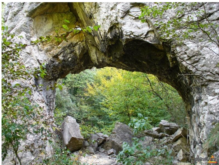
Portalul din Cheile Gârliștei

Rezervația naturală Cheile Gârliștei este o arie protejată de Categoria IV (IUCN). Căile de acces spre rezervație sunt DN Reșița - Anina și DN Oravița - Anina. Din Anina se merge spre nord pe firul râului Gârliște. Este o rezervație naturală mixtă (forestieră, geomorfologică și geologică) situată în Munții Aninei și se întinde pe o suprafață de 517 hectare la o altitudine maximă de 690 metri. Rezervația face parte din Parcul Național Semenic - Cheile Carașului.