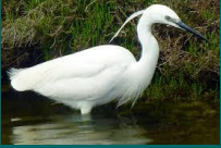
Egreta albă mică ( Egretta garzetta )