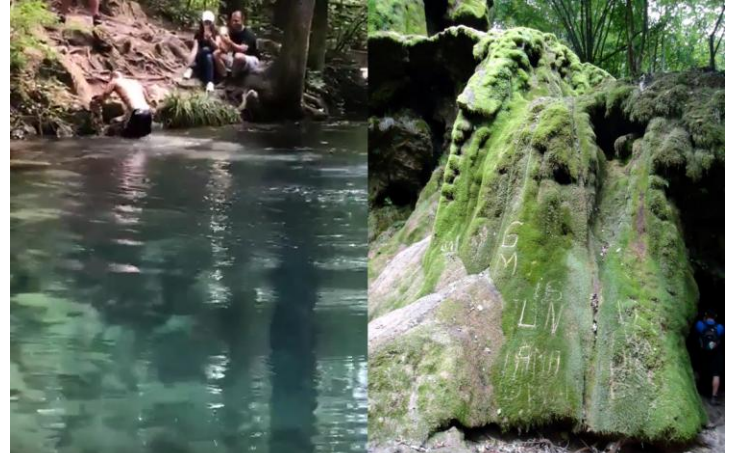
Agresiuni împotriva patrimoniului natural al PN Cheile Nerei - Beușnița

Cazul seamănă cu cel din anul 2016 când deversorul cascadei Beușnița a fost scrijelit iar făptașii au rămas neidentificați.