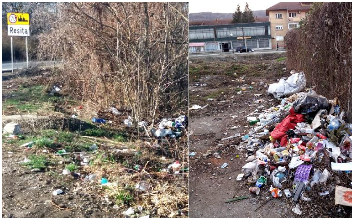
Gunoaie prin Reșița la tot pasul.

Concluziile activității de monitorizare vor fi incluse într-un raport detaliat care va fi înaintat autorităților cu responsabilități directe în protecția mediului solicitându-se cu această ocazie și puncte de vedere și măsuri pentru combaterea agresiunilor constatate cu ocazia campaniei de monitorizare.