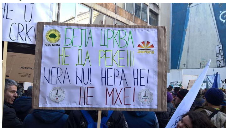
27 ianuarie - miting la Belgrad împotriva construirii de MHC-uri pe râul Nera

Este sloganul mitingului de protest al societății civile împotriva construirii de microhidrocentrale pe râurile de munte din Serbia care a avut loc în data de 27 ianuarie a.c în Piața Studenților din Belgrad. Grupul Ecologic de Colaborare Nera (GEC NERA); organizație nonguvernamentală, apolitică și nonprofit (detalii pe www.gecnera.ro ); a participat la acest miting de protest împreună cu un grup de ONG-uri din Serbia care se opun construirii de microhidrocentrale (MHC) în zona localității Kusić, pe teritoriul Comunei Bela Crkva (Biserica Albă), lucrări care ar urma să devieze pe teritoriul Serbiei și să folosească o mare parte a debitului râului Nera pentru funcționarea acestor MHC-uri.