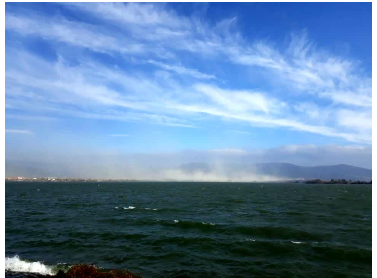
"Spectacol" oferit în Serbia de poluarea din 2-6 aprilie de la Moldova Nouă.

Specialiștii de la Ministerul Economiei, Agenția de Protecția Mediului și Primăria Moldova Nouă au dat acorduri de mediu și autorizații pe o soluție tehnică care, cel mai probabil, nu va produce stoparea poluării. Problema este cine va plăti eșecul? Cu siguranță locuitorii din Clisură cu sănătatea și cu taxele și cu impozitele colectate la bugetul de stat de unde s-a finanțat proiectul.