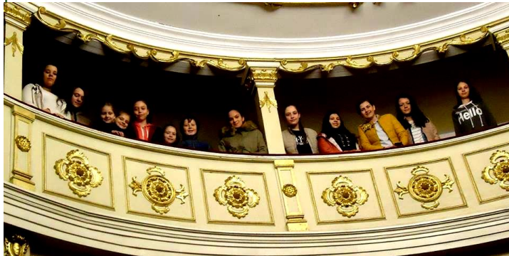
Voluntari de la Școala Gimnazială "Atanasie Cojocaru" Pojejena în vizită la Teatrul Vechi MIHAI EMINESCU din Oravița.

Grupul Ecologic de Colaborare Nera (GEC NERA); organizație nonguvernamentală, apolitică și nonprofit (detalii pe www.gecnera.ro ) va implementa în anul 2019 activități de voluntariat destinate protecției mediului și promovării ecoturismului.